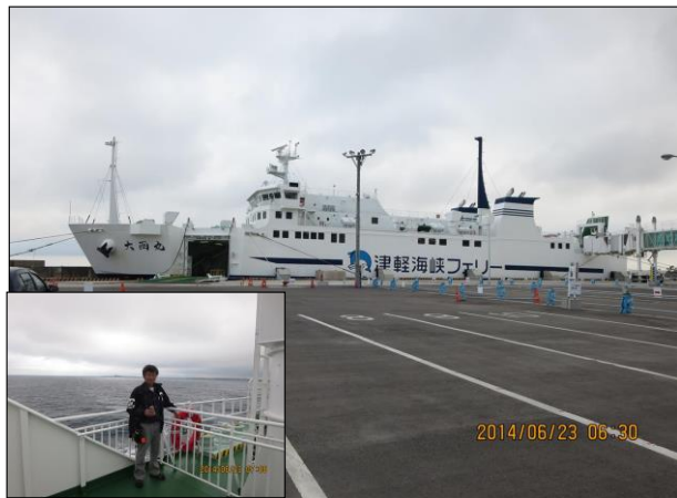
このフェリーででっかい道到着